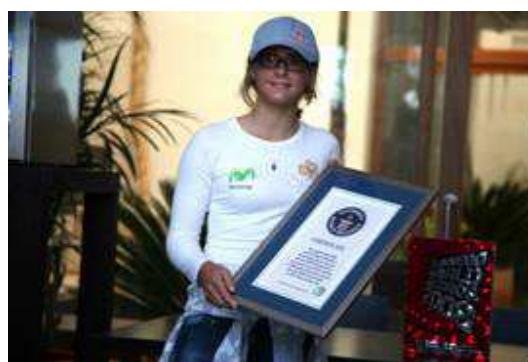
Guinness Record, Tarifa (noviembre 2007)

En diciembre de 2007 es condecorada en la Gala de 70 Aniversario de Marca como uno de los 100 mejores deportistas de España, siendo la atleta más joven en conseguir esta distinción.