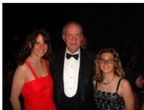
Laureus Sports Awards, Barcelona (marzo 2007)