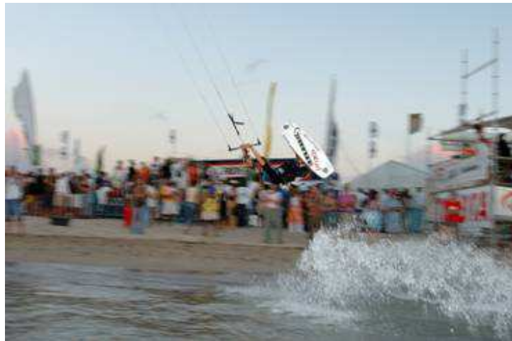
Final en Nueva Caledonia (noviembre 2004)

Caledonia donde se proclama Campeona del Mundo en el circuito profesional KPWT en noviembre de 2004 a la edad de 10 años.