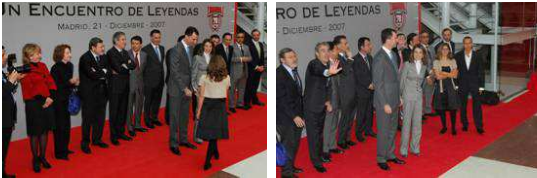
Gala 70 aniversario del diario Marca, Madrid (diciembre 2007)

En el ámbito deportivo, 2007 es también un gran año para Gisela. En marzo de 2007 recibe la autorización de la Professional Kiteboard Riders Association para poder participar en 2007 en todos los eventos de la Copa del Mundo. Tras revalidar su título de Campeona de España de Kiteboarding, en septiembre de 2007 se proclama por primera vez campeona del Mundo PKRA, en las frías aguas del Mar del Norte, en Alemania. Gisela domina el circuito profesional en 2007 con 6 victorias y dos segundas plazas, en las 8 etapas en las que participa.