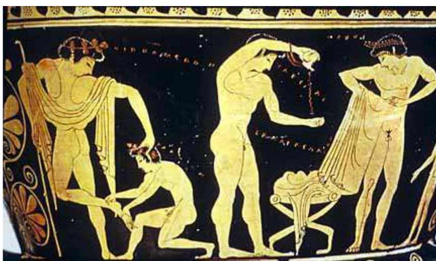
Atletes preparant-se. Un d'ells s'unta amb oli.

A la Grècia clàssica els exercicis físics eren, al costat de l'aprenentatge de les lletres i de la música, una part fonamental de l' educació dels nois. A partir dels dotze anys, almenys en les famílies benestants, el noi era confiat a un preparador que l'instruïa en el gimnàs o la palestra -un espai cobert de sorra a l'aire lliure quadrat i voltat de vestidors, banys i altres sales.